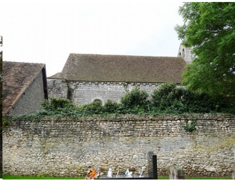
La chapelle vue depuis le cimetière