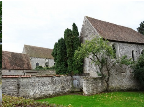
La chapelle et l'ancienne église Saint Pierre