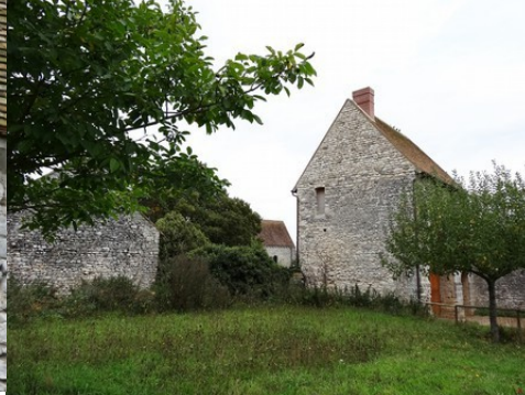
La porterie et la chapelle vues du verger