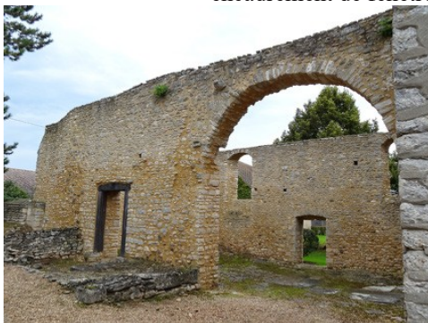
Des ruines voisines de la chapelle

Les avis seront cohérents avec ceux émis ces derniers années, à savoir : pas de maisons à volume compliqué (type V, W, Y, ou Z), pentes à 45° pour les volumes principaux, ardoise ou tuile plate de teinte brun vieilli, à 20u/m 2 , avec un débord de toiture de 20cm, enduit de teinte beige clair avec modénatures (au choix : chaînages, encadrement de fenêtres, soubassement, colombage...). *Voir les autres fiches.