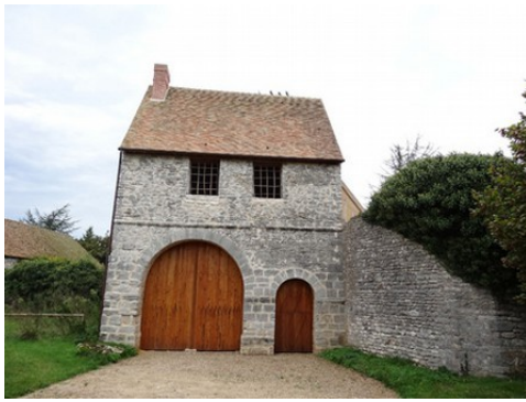
La porterie restaurée