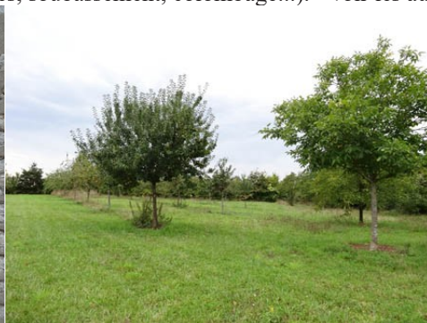
Le verger voisin