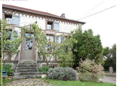
Une maison du voisinage