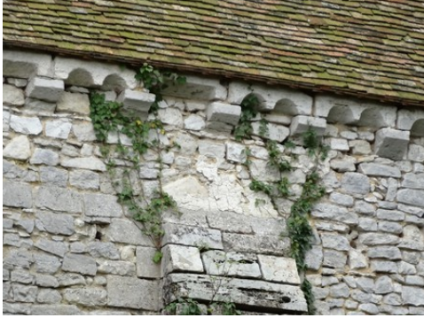
Un détail de la corniche de la chapelle