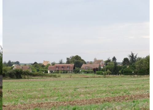
La commanderie vue depuis les champs