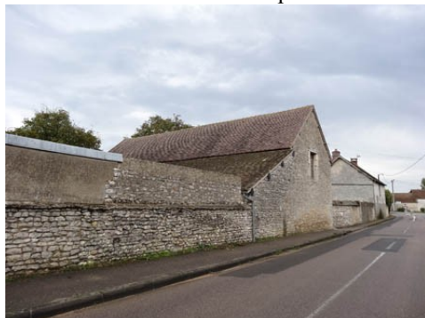
L'environnement rural du monument